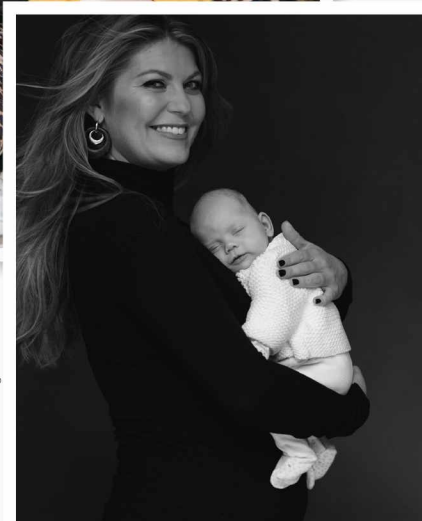
FOTOGRAFIE: NINE JFF